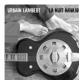
La nuit Navajo