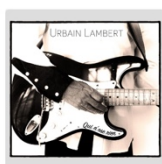
Qui n'ose rien