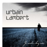
Je rentre chez moi